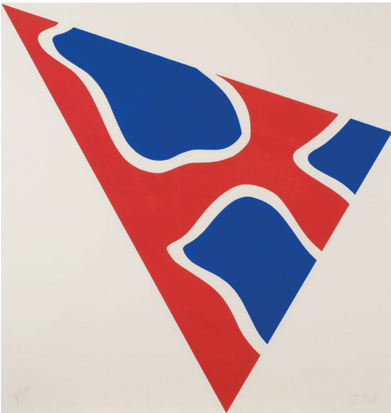
Claude Viallat , Triangle , 1992 Aquatinte en couleurs, 83 x 87 cm