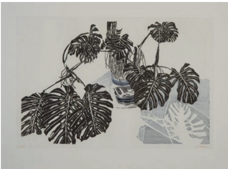
Sam Szafran , Philodendrons , 1996 Aquatinte en couleurs, 65 x 86,5 cm