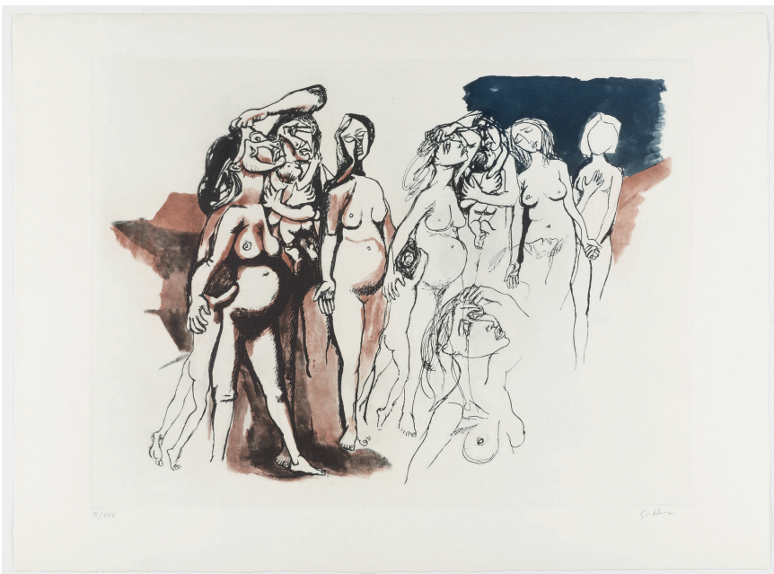
Renato Guttuso , Untitled (Hommage à Picasso), 1973 Eau-forte et aquatinte, 45,5 x 60,5 cm