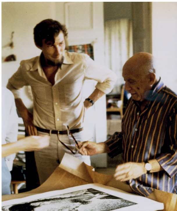
Piero Crommelynck et Picasso en 1968