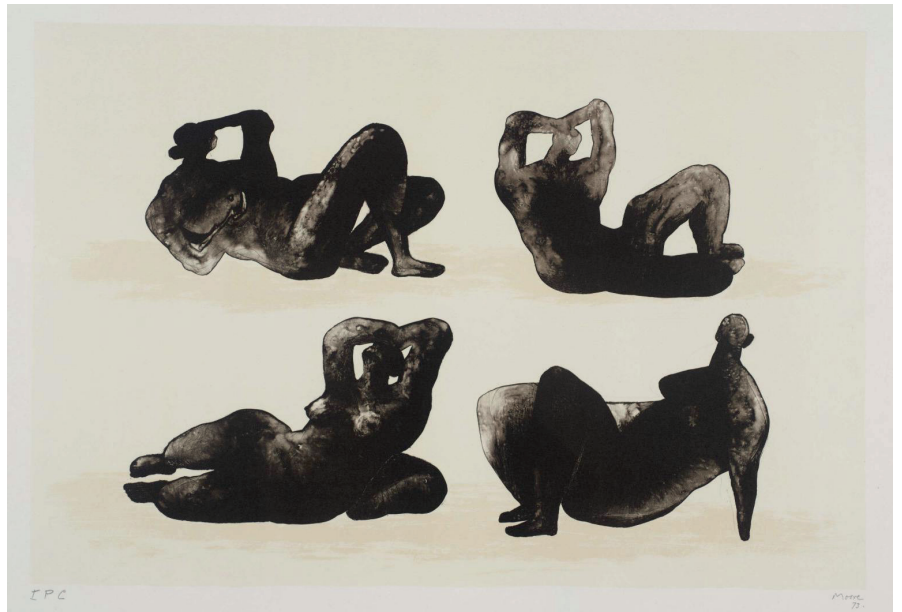
Henry Moore , Untitled (Hommage à Picasso), 1973 Lithographie, 41,8 x 42,2 cm