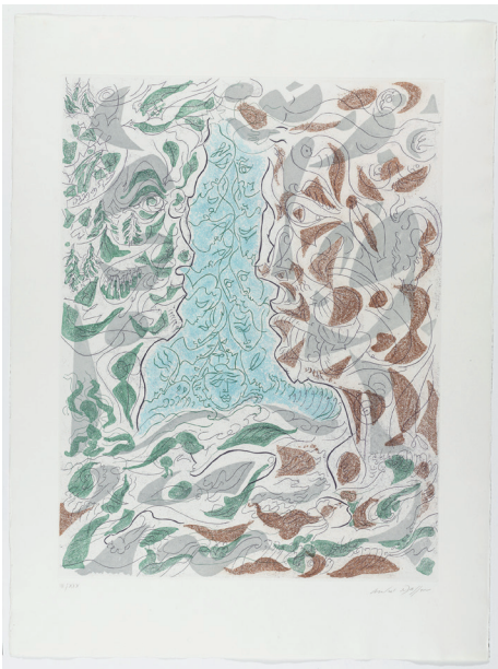
André Masson , Untitled (Hommage à Picasso), 1973 Aquatinte, 60 x 45 cm

Les œuvres de ce corpus ont été exposées en 2016 lors des expositions « Hommage à Picasso » à la Künstlerhaus de Munich et « Picasso.mania » au Grand-Palais de Paris. Aujourd'hui, dans la project room de la galerie Dutko, une sélection de vingt-et-une œuvres de l'hommage collectif au peintre sera présentée.