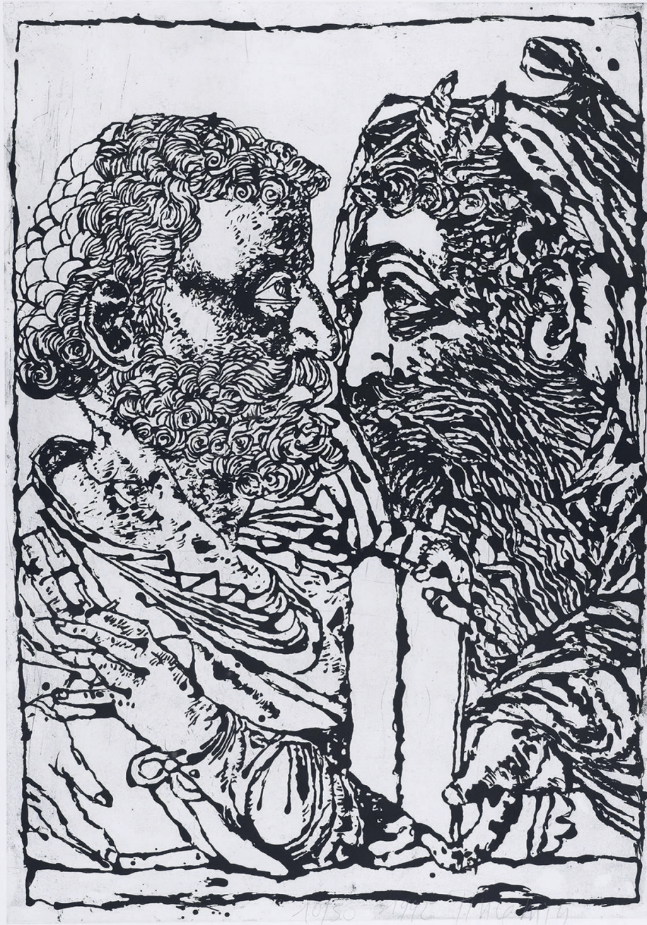
Jean-Pierre Pincemin, Moïse et Saint Pierre , 1992 Aquatinte en noir sur vélin de Rives, 112,5 x 80 cm