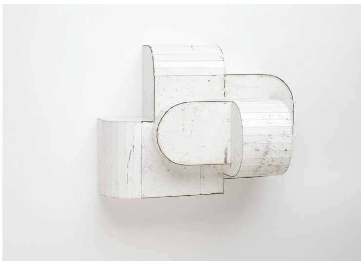
Clean Boy , 2019, Salvage Steel, Marine-grade Plywood, Silicone, Vulcanized Rubber, 25 x 32 x 20 cm / 10 x 12 1/2 x 8 in.

Vernissage le jeudi 24 septembre, 17h - 21h